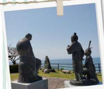
良寛と夕日の丘公園