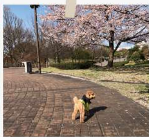
よくお散歩に行く信濃川の土手

田宮病院・ふれ愛サポートセンター いずもざき・リハビリセンター王見台・ こぶし園の、職員・ご利用者さんより、 お気に入りの景色を教えてくださいました！